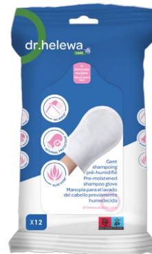
Paquet de 12 REF 34.3940