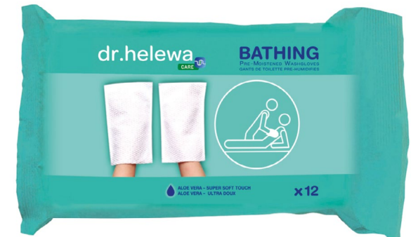
Paquet de 12 REF 34.3930