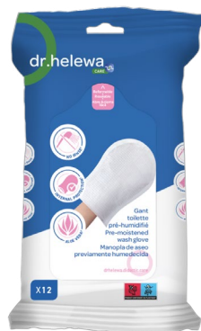
Paquet de 12 REF 34.3925